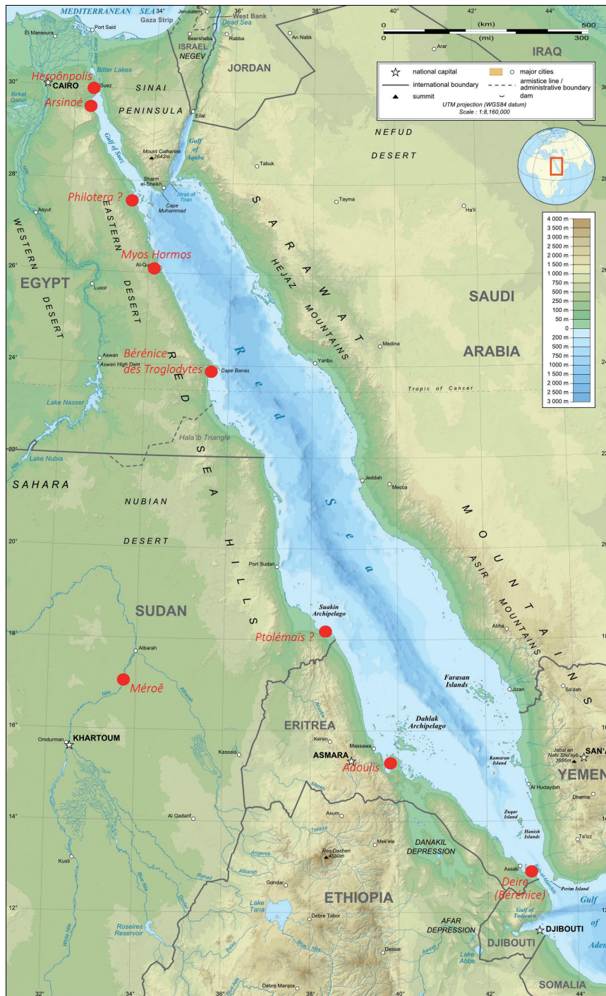
Fig. 1 : la présence grecque sur le littoral africain de la mer Rouge