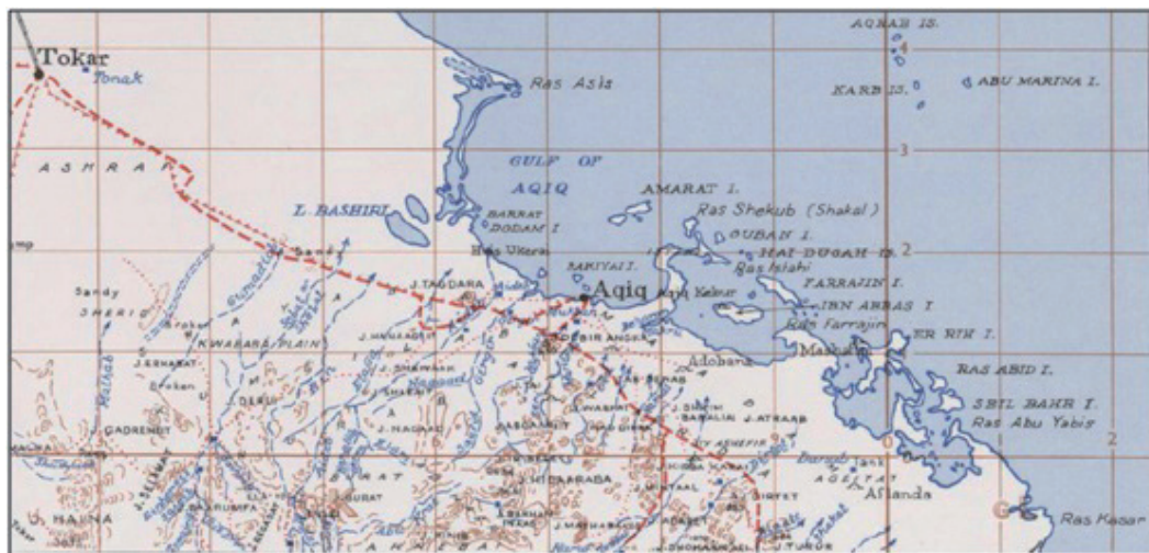
Fig. 5 : la région d'Aqiq

(U.S. Army Map Service - Series Y401 (GSGS 4355) - feuille Port Sudan ; avec l'aimable autorisation de la Perry-Castañeda Library Map Collection)