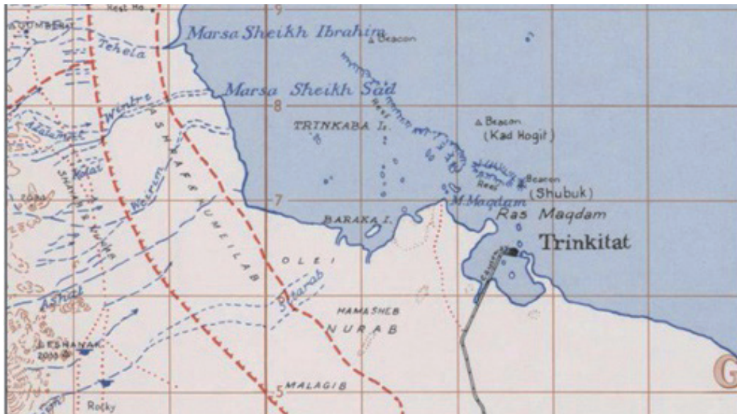
Fig. 3 : le secteur de Trinkitat

(U.S. Army Map Service - Series Y401 (GSGS 4355) - feuille Port Sudan ; avec l'aimable autorisation de la Perry-Castañeda Library Map Collection)