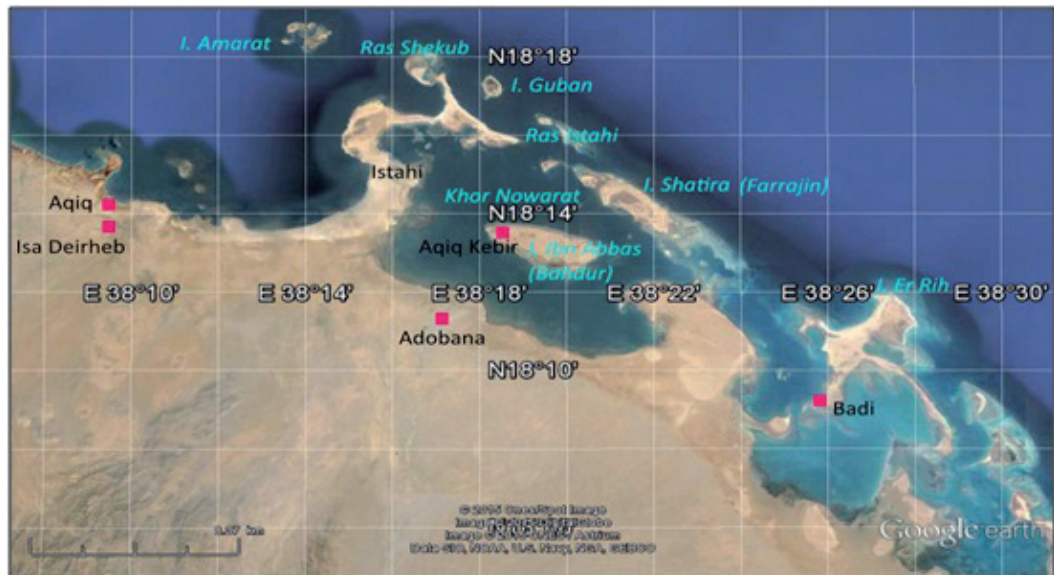
Fig. 6 : la région d'Aqiq vue de satellite

(échelle : 8, 37 km ; carte établie par l'auteur à partir d'une photo Google Earth ©)