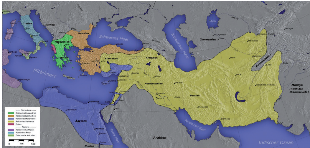
Fig. 2 : le monde hellénistique à la fin du III e siècle a.C.)

(auteur : Captain Blood ; source : Wikimedia Commons)