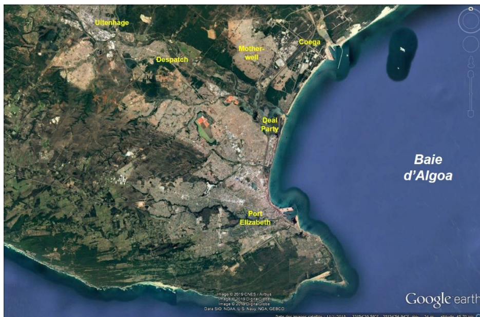
Figure 2 – Extraction Google Earth situant le bipôle portuaire de la baie d'Algoa dans son environnement urbain

Lancés en 2002 au niveau de l'estuaire du petit fleuve Coega 1 en profitant d'un paléo-chenal, les travaux du port visaient à réaliser, à l'abri de deux jetées extérieures (de respectivement 2700 et 1125 mètres), un terminal à conteneurs (TC1 à la figure 3 infra ) et, pour desservir les usines de la zone industrielle adjacente, une jetée vraquière (PV à la même figure). Celle-ci est restée pratiquement sans usage jusqu'il y a peu, alors que le quai à conteneurs, dont la longueur initiale n'était que de 780 mètres, a dû être rapidement allongé à 1340 mètres, dont 1300 mètres utiles ; typiquement, deux unités océaniques d'une capacité allant jusqu'à 12.500 EVP 2 et deux navires d'apport