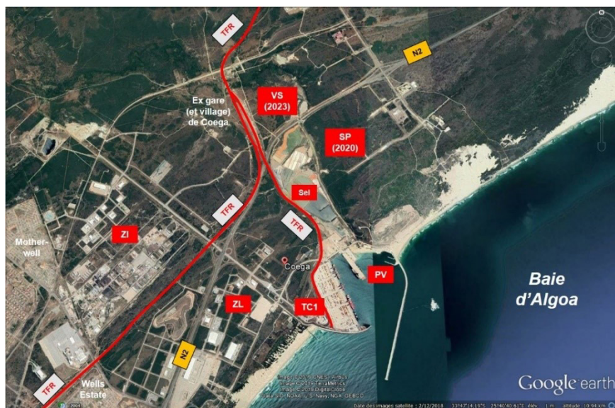
Figure 3 – Extraction Google Earth présentant la situation actuelle du port de Coega

l’actuel terminal minéralier, que TNPA prévoit de convertir en terminal voiturier pour ne pas devoir fermer le terminal à conteneurs, alors que les acteurs urbains convoitent cet espace pour une seconde phase de leur opération urbano-portuaire.