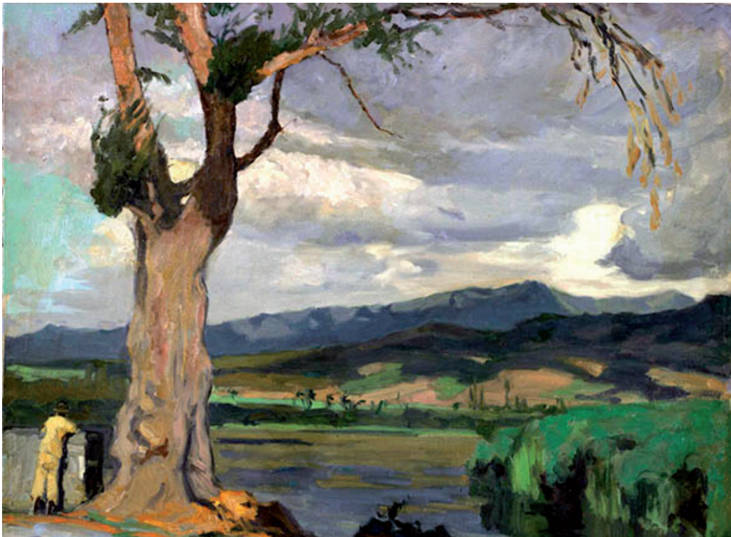
Figure 4 : Les dessertes domestiques sud-africaines assurées par des LCCs en été 2019

Limitées aux relations intérieures, ces deux cartes ne montrent pas que certaines compagnies débordent plus ou moins largement des frontières sud-africaines. Pour la South African Airways, c’était même l’essentiel de son fonds de commerce, avec des lignes intercontinentales et vers le reste de l’Afrique sub-saharienne (Pirie, 2006). C’était aussi le cas de ses deux affiliés régionaux qui complètent son offre en desservant des lignes sur certaines destinations secondaires des pays voisins (ainsi que depuis Le Cap sur la Namibie). Parmi les autres acteurs, British Airways/Comair a pu obtenir des droits de trafic sur certaines de ces destinations proches (Windhoek, Livingstone, Victoria Falls et Harare), ainsi que sur Maurice. Des vols de mi-journée étaient alors organisés depuis et vers le hub du Gauteng, à la fois dans le cadre de trafics de point à point et en correspondance avec les services intercontinentaux du transporteur britannique ainsi qu’avec les opérations domestiques de sa franchise sud-africaine. En situation pré-COVID 19 toujours, les LCCs sud-africaines ne débordaient par contre pas des frontières du pays, à l’exception très marginale de quelques vols de fin de semaine de Mango sur Zanzibar depuis et vers les deux aéroports du Gauteng.