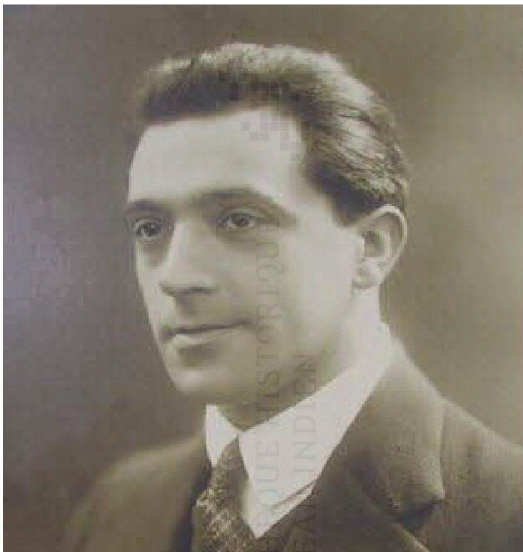
Figure 1 : Le trafic des passagers des principaux aéroports africains en 2018

Au sud du Sahara, outre Maurice (MRU) dans l'océan Indien 1 , douze aéroports importants se dégagent sur le continent, cinq en Afrique occidentale 2 , quatre du côté oriental 3 et trois en Afrique du Sud où ressortent les trois plates-formes qui