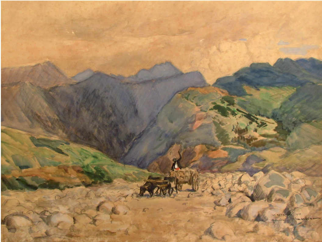
Figure 2 : Les trafics aéroportuaires totaux sud-africains en 2019